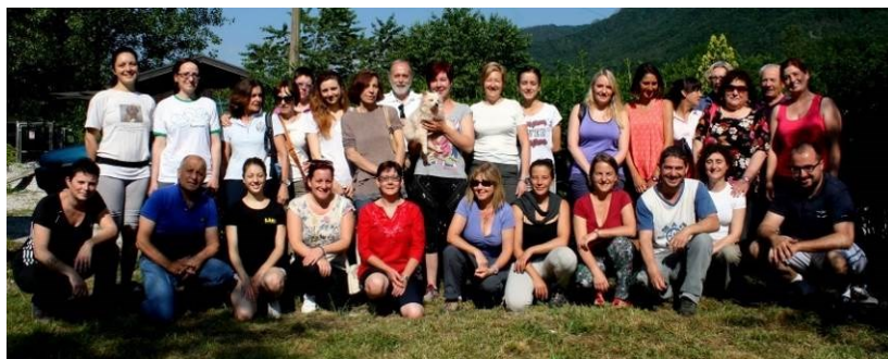
I PARTECIPANTI AL PRIMO CORSO DI FORMAZIONE PER VOLONTARI DEL RIFUGIO (MAGGIO 2015)

Nel 2015, questo gruppo di soci e volontari produce nell'associazione un cambiamento di rotta, che porta molti giovani anche all'interno degli organi direttivi eletti il 21 febbraio da una movimentata assemblea, in cui a prevalere è la prospettiva di futuro assicurata da un ricambio generazionale affatto scontato in un momento storico in cui sembra prevalere il disimpegno, soprattutto nelle generazioni più giovani.