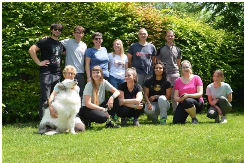
IL 10 GIUGNO SI CHIUDE L'ESPERIENZA IN CANILE DEL PRIMO GRUPPO DI PARTECIPANTI AL PROGETTO EPTAGIVES.

Il 10 giugno si chiude la prima esperienza in canile-rifugio di EptaGIVES , il programma di volontariato aziendale attraverso il quale Epta Spa