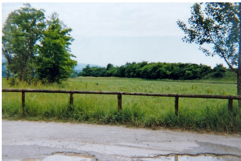
IL TERRENO SU CUI SORGERÀ IL CANILE-RIFUGIO DI APACA