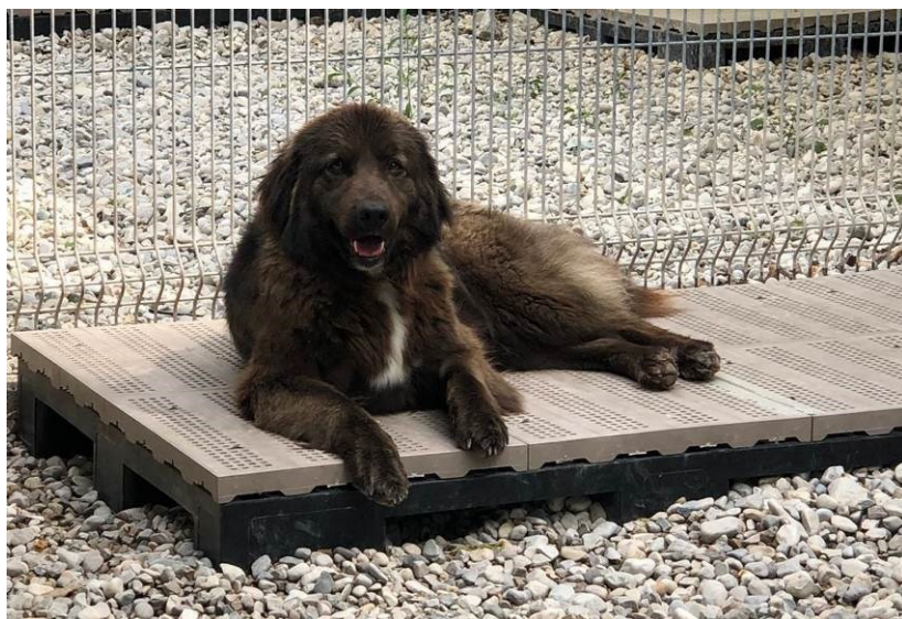
A INIZIO 2018 I BOX VENGONO DOTATI DI NUOVI BANCALI IN PVC

Il 28 aprile APACA viene accolta nel Comitato d'Intesa tra le Associazioni Volontaristiche della provincia di Belluno: è la prima organizzazione animalista ad entrare in un consesso dove, sino a quel momento, l'unico volontariato conclamato era quello verso la specie umana. Il 31 maggio l'associazione ottiene l'iscrizione al n. BL0274/2018 del Registro delle Organizzazioni di Volontariato della Regione Veneto.